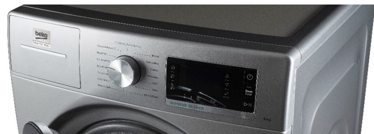
Bandeau de commande avec zone de saisie tactile Programmation facile et intuitive