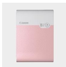
Canon SELPHY SQUARE QX10