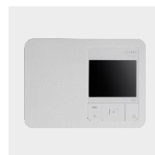
Canon SELPHY CP1500