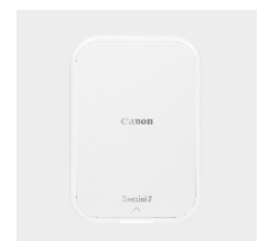
Canon Zoemini 2