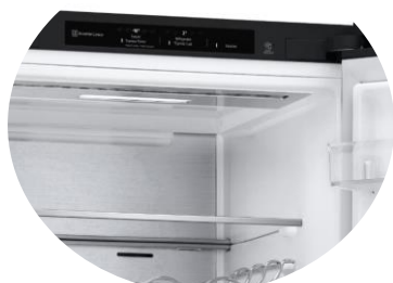
Display intérieur discret