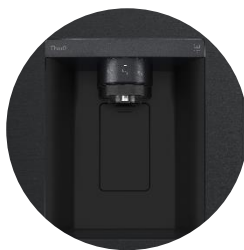
Distributeur d'eau épuré