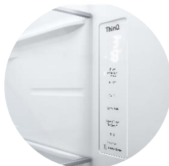
Affichage intérieur discret