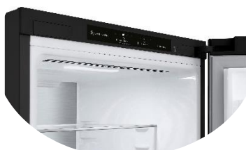
Affichage intérieur discret