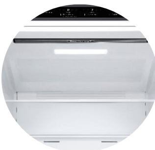
Door Cooling™ & Soft LED