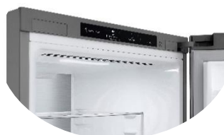
Display intérieur discret