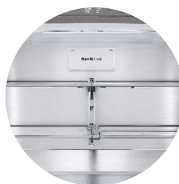
Filtre anti-odeur Pure N Fresh