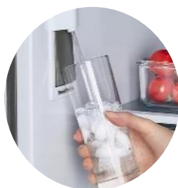
Distributeur d'eau discret