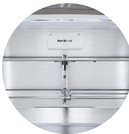
Filtre anti-odeur Pure N Fresh