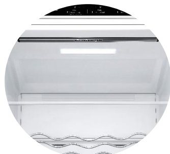
Door Cooling™ &amp; Soft LED