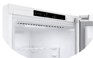
Display intérieur discret