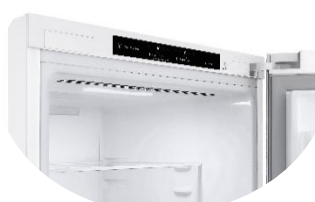
Display intérieur discret