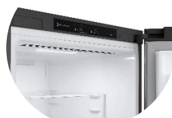
Display intérieur discret