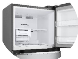
Fabrique à glace Twist Ice™