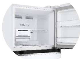
Fabrique à glace Twist Ice™