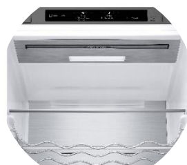
Display intérieur discret