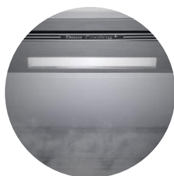
Éclairage Soft LED