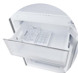
Bac à glaçons avec réservoir