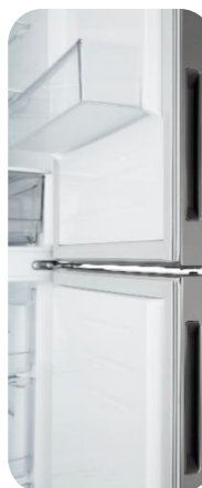
Poignées intégrées discrètes