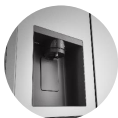
Distributeur d'eau épuré