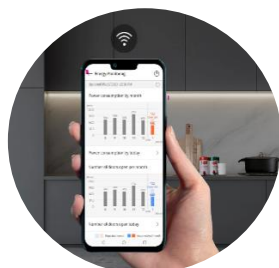
Connectivité LG ThinQ™