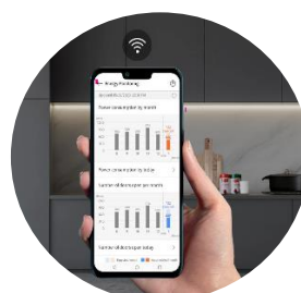
Connectivité LG ThinQ™