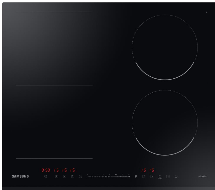
TABLE À INDUCTION 4 FOYERS – ZONE MODULABLE