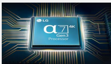
Processeur α7 Gen 3

Développé par LG, le processeur α7 Gen 3 est le cerveau de votre téléviseur. La qualité d'image est optimisée : les couleurs sont plus riches et les scènes plus détaillées.