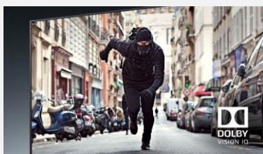
Dolby Vision IQ

Développé par LG, le processeur α7 Gen 3 est le cerveau de votre téléviseur. La qualité d'image est optimisée : les couleurs sont plus riches et les scènes plus détaillées.