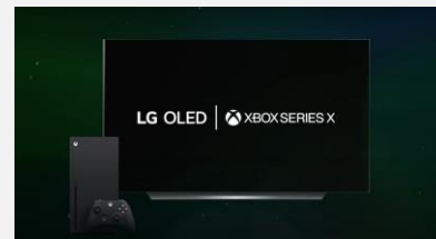
XBOX – Dolby Vision 4K/120is

Grâce à l'ajout des applications GeForce Now et de Stadia, tout un univers de jeux vous attend grâce au Cloud Gaming. Redécouvrez les jeux que vous aimez et trouvez de nouveaux favoris directement à partir de votre téléviseur.