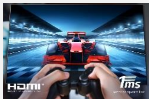
HDMI 2.1, VRR, ALLM

Prenez l'avantage sur vos adversaires. Compatible HDMI 2.1, VRR (G-sync et Freesync) et ALLM, pour offrir les contenus les plus rapides en haute résolution avec des graphismes fluides et synchronisés.