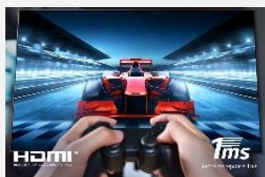
HDMI 2.1, VRR, ALLM

Prenez l'avantage sur vos adversaires. Compatible HDMI 2.1, VRR (G-sync et Freesync) et ALLM, pour offrir les contenus les plus rapides en haute résolution avec des graphismes fluides et synchronisés.