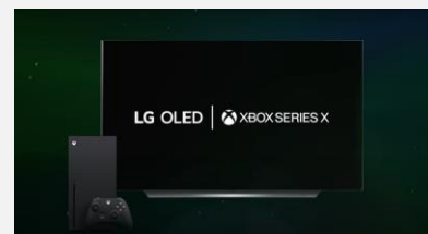
XBOX – Dolby Vision 4K/120is

Grâce à l'ajout des applications GeForce Now et de Stadia, tout un univers de jeux vous attend grâce au Cloud Gaming. Redécouvrez les jeux que vous aimez et trouvez de nouveaux favoris directement à partir de votre téléviseur.