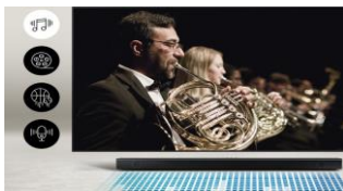
Adaptive Sound Lite

Son optimisé pour chaque scène Votre barre de son analyse le signal de fréquence de votre contenu de façon automatique afin d'optimiser l'effet sonore scène par scène et vous offrir une expérience sonore inédite.