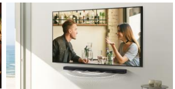
Accroche murale incluse

Grâce au mode nuit, soyez sûrs de ne pas réveiller les enfants. Le mettre en marche baisse automatiquement le volume, compresse les basses.