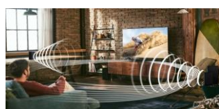
Système Home Cinéma

Contrôlez votre barre de son et l'ensemble de vos appareils avec une seule et même télécommande.