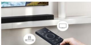
Une seule télécommande

Installez facilement votre barre de son au mur avec l'accroche murale incluse.