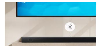
Connexion TV sans fil

Saisissez chaque mot et entendez clairement les dialogues grâce au mode voix claire.