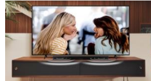
Mode voix claire

Le kit d'enceintes arrière sans fil SWA-9200S* vous permet de créer facilement un véritable son surround, sans l'encombrement d'un seul fil.