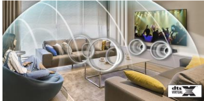
Son 3D immersif

La technologie DTS Virtual:X optimise le rendu sonore : basses renforcées, clarté des dialogues et effets surround. Elle donne au son une dimension verticale afin d'être plongé au cœur de l'action.