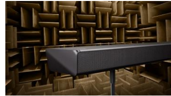
Audio Lab Samsung

La technologie DTS Virtual:X optimise le rendu sonore : basses renforcées, clarté des dialogues et effets surround. Elle donne au son une dimension verticale afin d'être plongé au cœur de l'action.