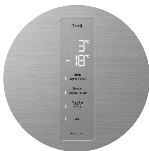
Interface digitale extérieure