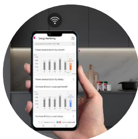
Connectivité Wifi avec LG ThinQ