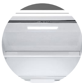
Éclairage Soft LED