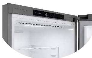
Display intérieur discret