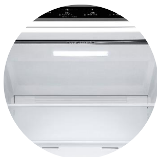
Door Cooling™ & Soft LED