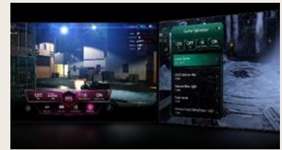
TABLEAU DE BORD & OPTIMISEUR DE JEU

L' intelligence artificielle s'invite dans votre interface webOS. Avec LG ThinQ , commandez votre téléviseur à la voix, que ce soit pour trouver votre prochain contenu à regarder en fonction de vos goûts, pour contrôler les objets connectés de votre foyer ou encore pour faire une requête à votre AI Chatbot .