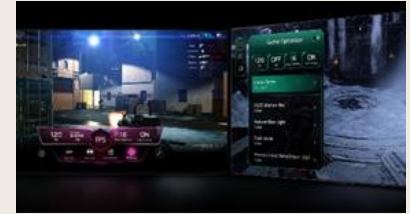
TABLEAU DE BORD & OPTIMISEUR DE JEU

L' intelligence artificielle s'invite dans votre interface webOS. Avec LG ThinQ , commandez votre téléviseur à la voix, que ce soit pour trouver votre prochain contenu à regarder en fonction de vos goûts, pour contrôler les objets connectés de votre foyer ou encore pour faire une requête à votre AI ChatBot .