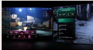
TABLEAU DE BORD & OPTIMISEUR DE JEU

L' intelligence artificielle s'invite dans votre interface webOS. Avec LG ThinQ , commandez votre téléviseur à la voix, que ce soit pour trouver votre prochain contenu à regarder en fonction de vos goûts, pour contrôler les objets connectés de votre foyer ou encore pour faire une requête à votre AI ChatBot .