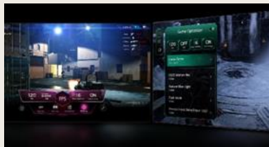
TABLEAU DE BORD & OPTIMISEUR DE JEU

L' intelligence artificielle s'invite dans votre interface webOS. Avec LG ThinQ , commandez votre téléviseur à la voix, que ce soit pour trouver votre prochain contenu à regarder en fonction de vos goûts, pour contrôler les objets connectés de votre foyer ou encore pour faire une requête à votre AI ChatBot .