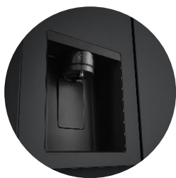
Distributeur d'eau épuré