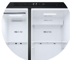
Affichage intérieur discret