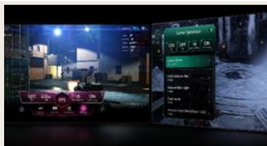
TABLEAU DE BORD & OPTIMISEUR DE JEU

L' intelligence artificielle s'invite dans votre interface webOS. Avec LG ThinQ , commandez votre téléviseur à la voix, que ce soit pour trouver votre prochain contenu à regarder en fonction de vos goûts, pour contrôler les objets connectés de votre foyer ou encore pour faire une requête à votre AI ChatBot .