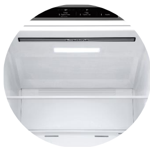
Door Cooling™ & Soft LED