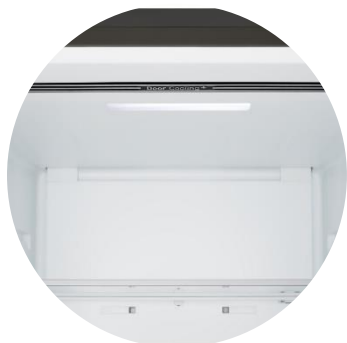
Door Cooling™ & Soft LED