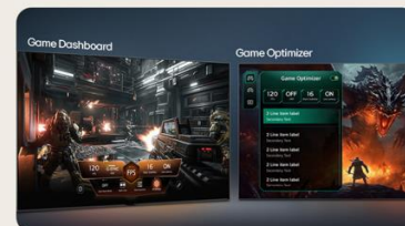
TABLEAU DE BORD & OPTIMISEUR DE JEU

L' intelligence artificielle s'invite dans votre interface webOS. Avec LG ThinQ , commandez votre téléviseur à la voix, que ce soit pour trouver votre prochain contenu à regarder en fonction de vos goûts, pour contrôler les objets connectés de votre foyer ou encore pour faire une requête à votre AI ChatBot .