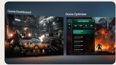
TABLEAU DE BORD & OPTIMISEUR DE JEU

L' intelligence artificielle s'invite dans votre interface webOS. Avec LG ThinQ , commandez votre téléviseur à la voix, que ce soit pour trouver votre prochain contenu à regarder en fonction de vos goûts, pour contrôler les objets connectés de votre foyer ou encore pour faire une requête à votre AI ChatBot .