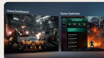
TABLEAU DE BORD & OPTIMISEUR DE JEU

L' intelligence artificielle s'invite dans votre interface webOS. Avec LG ThinQ , commandez votre téléviseur à la voix, que ce soit pour trouver votre prochain contenu à regarder en fonction de vos goûts, pour contrôler les objets connectés de votre foyer ou encore pour faire une requête à votre AI ChatBot .