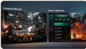
TABLEAU DE BORD & OPTIMISEUR DE JEU

L' intelligence artificielle s'invite dans votre interface webOS. Avec LG ThinQ , commandez votre téléviseur à la voix, que ce soit pour trouver votre prochain contenu à regarder en fonction de vos goûts, pour contrôler les objets connectés de votre foyer ou encore pour faire une requête à votre AI ChatBot .