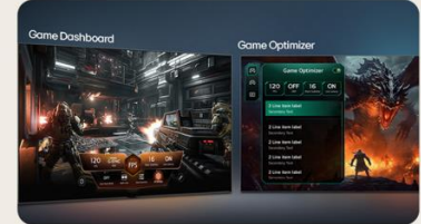
TABLEAU DE BORD & OPTIMISEUR DE JEU

L' intelligence artificielle s'invite dans votre interface webOS. Avec LG ThinQ , commandez votre téléviseur à la voix, que ce soit pour trouver votre prochain contenu à regarder en fonction de vos goûts, pour contrôler les objets connectés de votre foyer ou encore pour faire une requête à votre AI ChatBot .