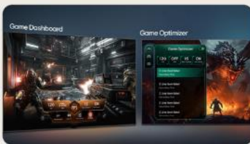
TABLEAU DE BORD & OPTIMISEUR DE JEU

L' intelligence artificielle s'invite dans votre interface webOS. Avec LG ThinQ , commandez votre téléviseur à la voix, que ce soit pour trouver votre prochain contenu à regarder en fonction de vos goûts, pour contrôler les objets connectés de votre foyer ou encore pour faire une requête à votre AI ChatBot .