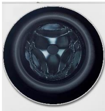
Hublot verre trempé