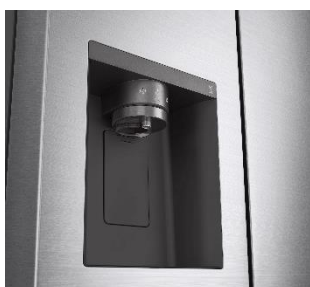
Distributeur d'eau épuré

Un volume total de 635L pour tous vos aliments et boissons